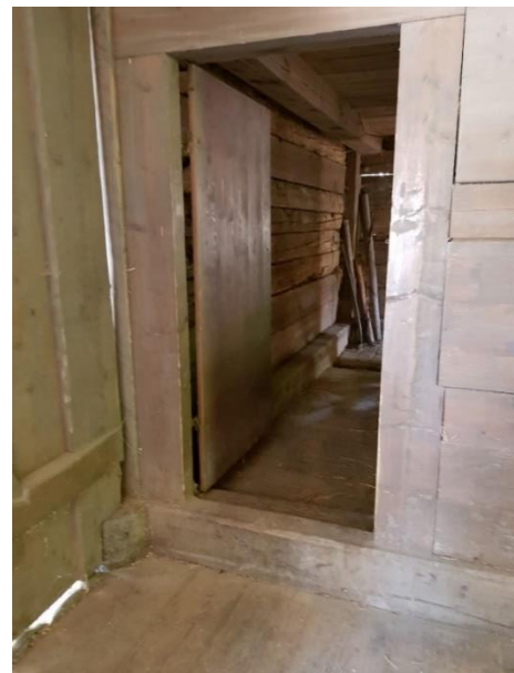
Übergang Stall / Tenne Tür: 80 cm, Schwelle: 21 cm innen, 11 + 4 cm innen