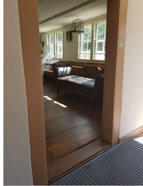
Stube Tür: 90 cm