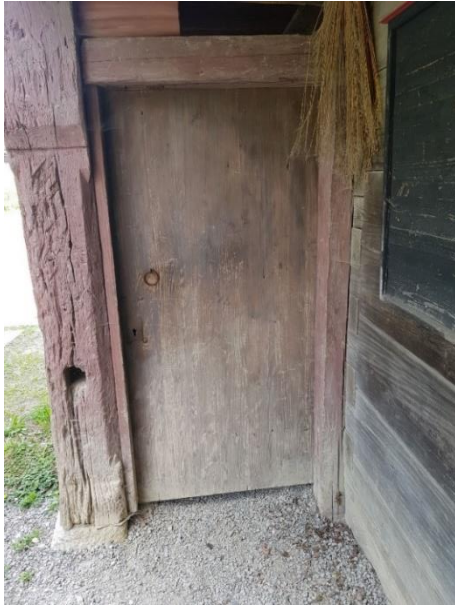
Zugang Wagenremise Tür: 83 cm, keine Schwelle, Kiesboden momentan geschlossen