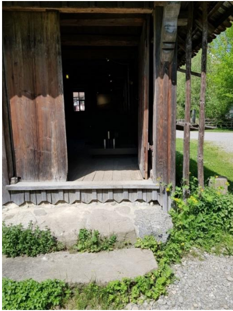
Eingang Käseausstellung Tür: 94 cm, 3 Stufen: 15, 16 und 26 cm