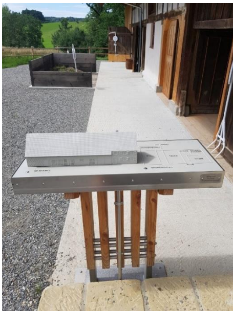
3D-Modell des Hof Beck Mit Grundriss und Audioausgabe