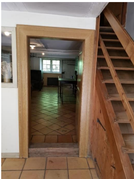
Küche Tür: 78 cm, Schwelle: 13 cm