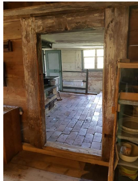
Küche Tür: 83 cm, Schwelle: 7-11 cm