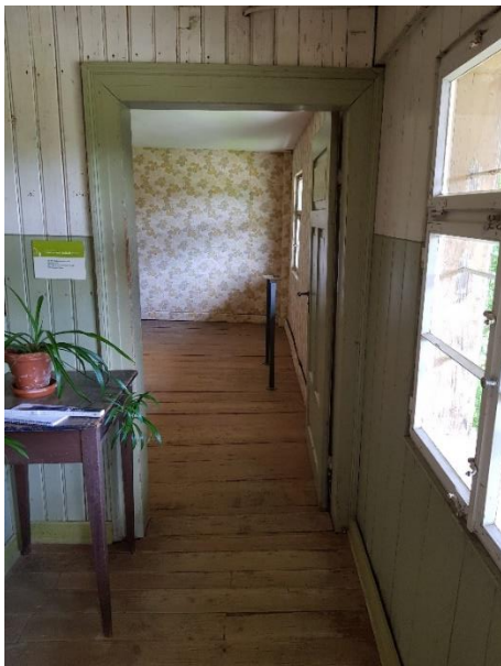
Gästezimmer Tür: 82 cm, Schwelle: 0 - 2,5 cm