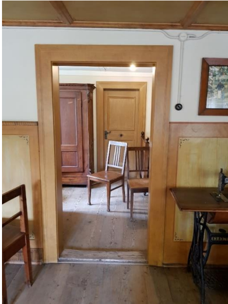
Kammer Tür: 85 cm, Schwelle: 1,5 cm