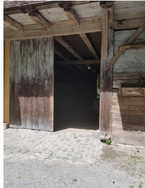
Zugang vom Fischerschopf Tor: 180 cm, ohne Schwelle