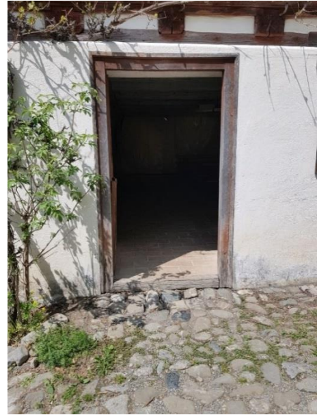
Tenne Tür: 91 cm, Schwelle: 12 cm, innen 2 cm