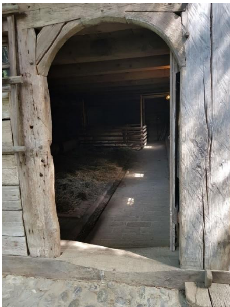
Stall Tür: 96 cm, Schwelle: 21 cm außen, 26 cm innen