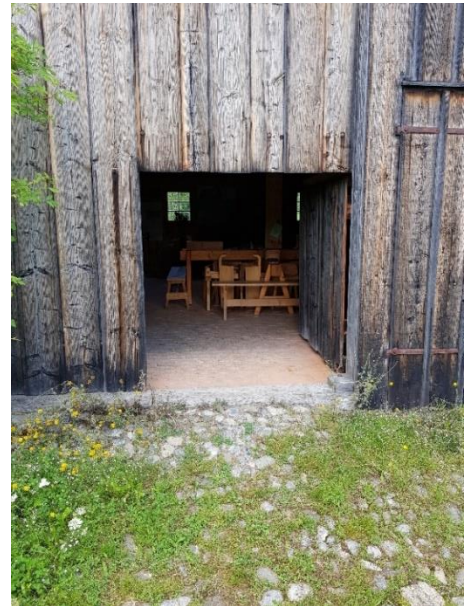
Eingang Stall Tor: 150 cm, Schwelle: 4-6 cm