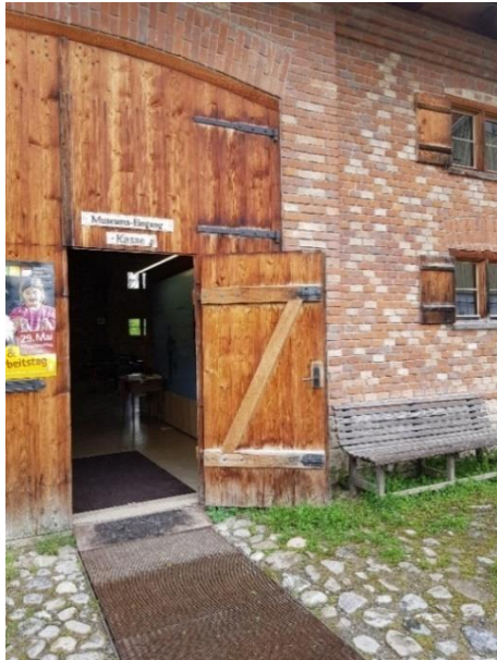
Eingang Zehntscheuer/ Museumskasse Tür: 100 cm, Schwelle: 5 cm mit Rampe