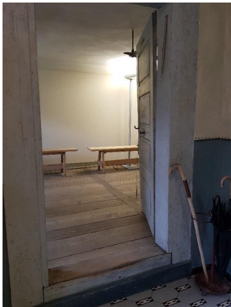
Stube rechts Tür: 84 cm, Schwelle: 23 cm