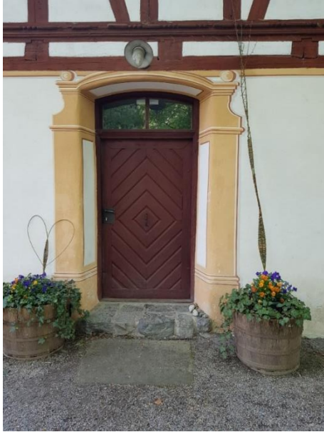
Eingang Gaststätte Tür: 101 cm, Schwelle: 15 cm