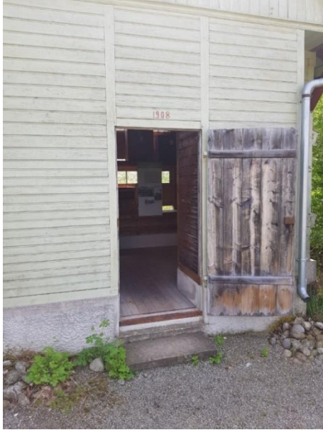
Tür: Breite 81 cm 2 Stufen: 10 cm und 19 cm