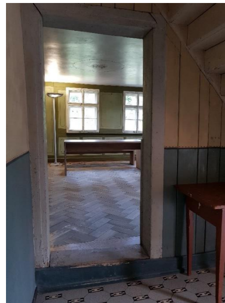
Große Stube links Tür: 84 cm, Schwelle: 18 cm