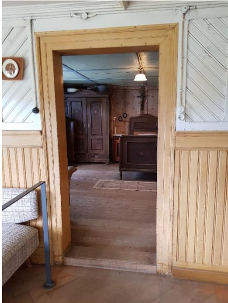
Stube Tür: 82 cm, Schwelle: 3,5 - 8 cm