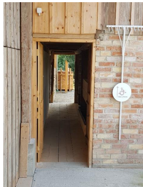
Schweinestall Türen: 80 bzw. 87 cm mit Schwelle 4 cm