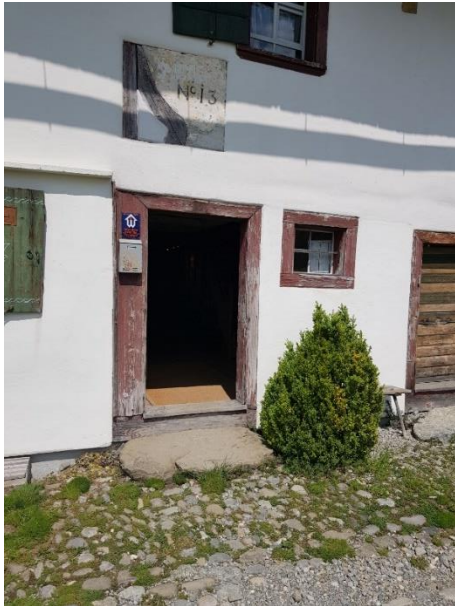
Eingang Wohnhaus Tür: 85 cm, Schwellen: 10 und 18 cm