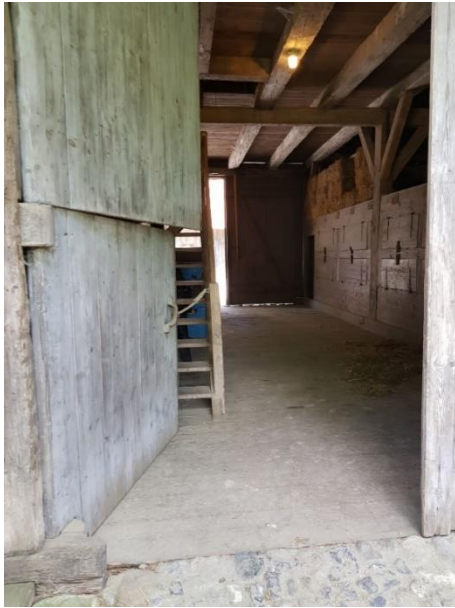
Zugang vom Haus Füssinger Tor: 175 cm, ohne Schwelle