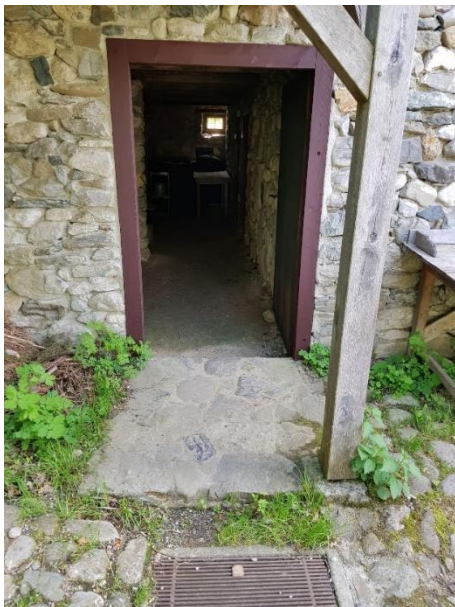
Keller Tür: 99 cm, Schwelle: 8,5 cm außen, 16 cm innen