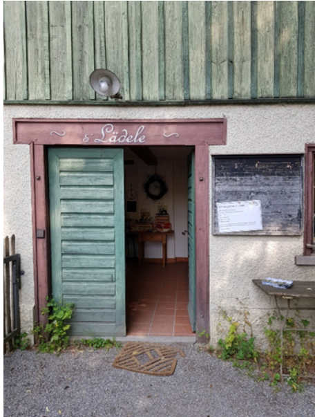
Eingang Läden, Museumsgelände Tür: 72 cm, Schwelle: 3.5 cm

An der Fischhältere befindet sich eine barrierearme Toilette.