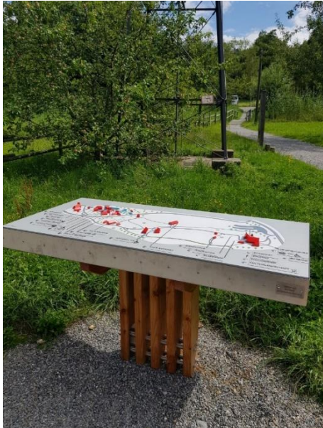
Museumseingang: tastbarer Museumsplan mit Audioausgabe