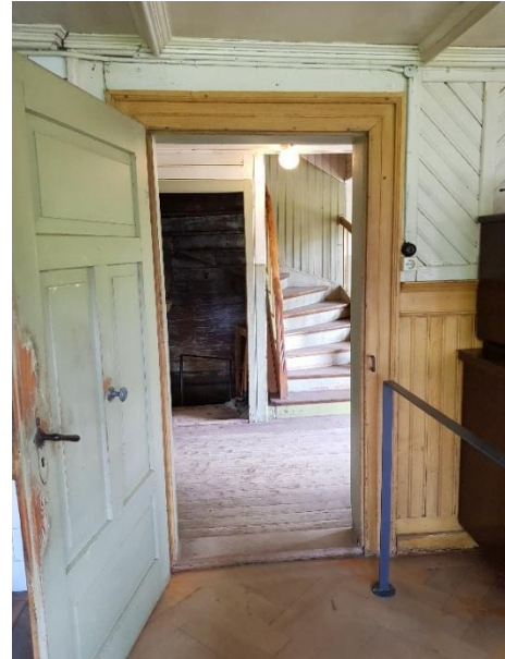
Flur Tür: 87 cm, Schwelle: 1,5 - 4,5 cm