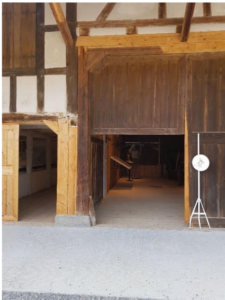
Tenne Tor: 190 cm Stall (linke Tür) Tür: 82 bzw. 90 cm