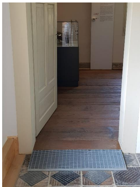
Stubenkammer Tür: 84 cm