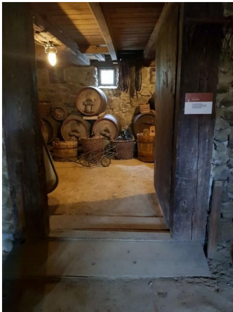
Mostkeller Tür: 108 cm, Rampe mit Schwelle 2 cm außen, 5 cm innen