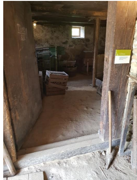
Kartoffelkeller Tür: 110 cm, Schwelle: 15 cm außen, 4 + 10 cm innen