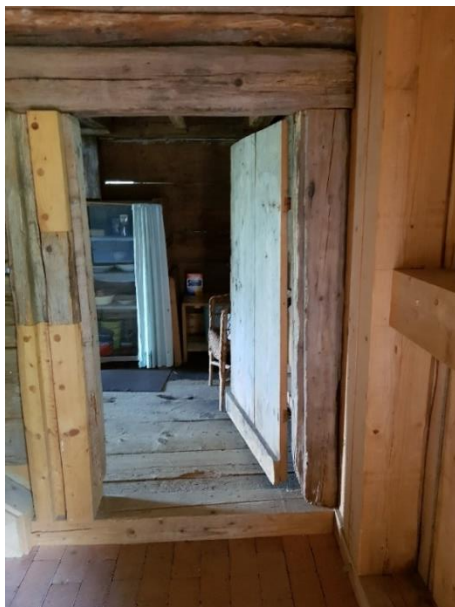
Durchgang zum Wohnteil Tür: 76 cm (Türstock 80 cm), Schwelle: 5-12 cm