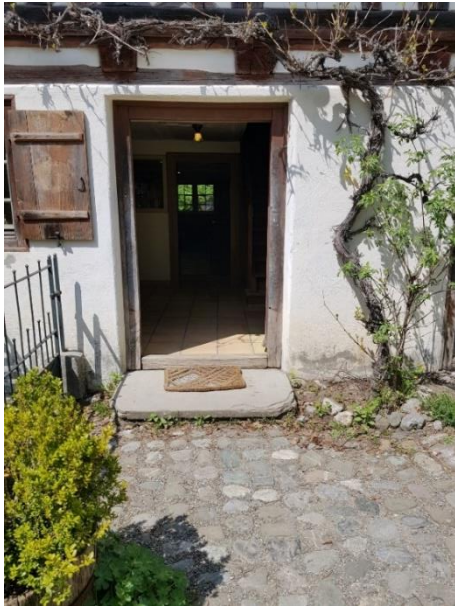
Wohnteil Tür: 97 cm, Schwelle: 12/10 cm, innen 4 cm