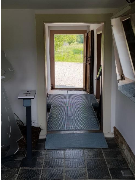
Flur Tür: 94 cm