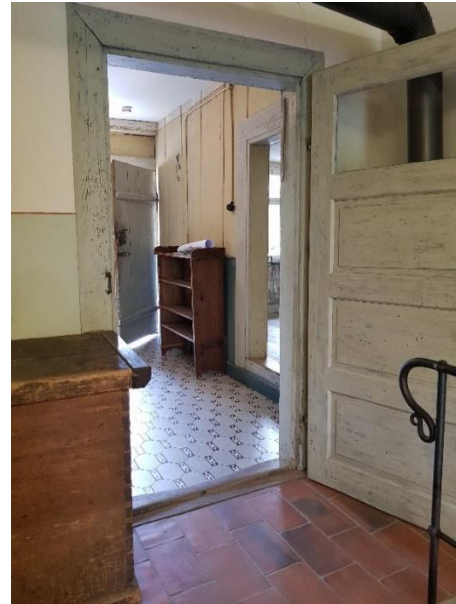
Durchgang zum Flur Tür: 89 cm, Schwelle 2-4 cm