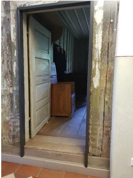
Kammer links Tür: 79 cm, Schwelle: 23 cm