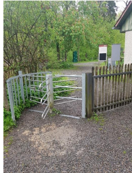
Durchgang durch das Tor ist möglich; bitte Schlüssel im Lädlele erfragen