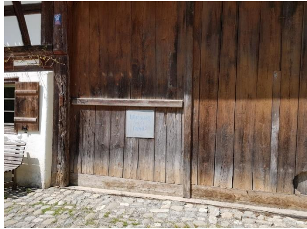
Tenne / Ausstellungsraum Tor: 207 cm, Schwelle: 3 cm