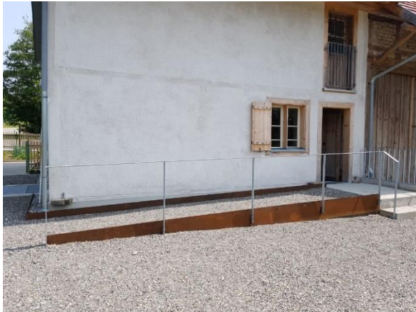
Eingang Rückseite mit Rampe Tür: 85 cm

Im Erdgeschoss sowie im modernen Anbau sind alle Räume barrierearm zugänglich.