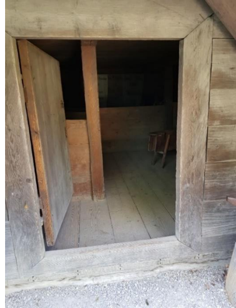
Zugang Fruchtkasten Tür: 96 cm, Schwelle: 31 cm außen, 12 cm innen