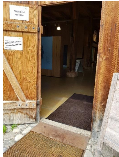
Ausgang Rückseite Tür: 100 cm, Schwelle: 5 cm mit Rampe