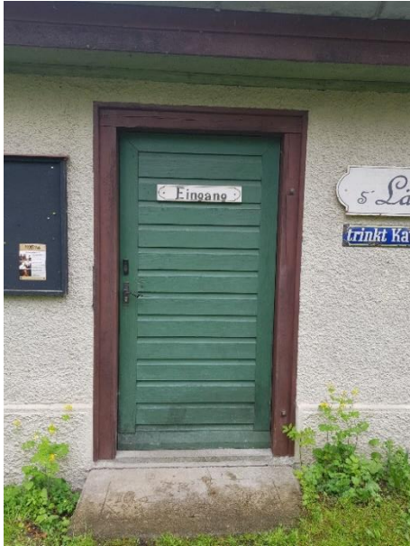
Ausgang Lädlele mit Drehkreuz Tür: 98 cm, Schwelle: 4,5 cm