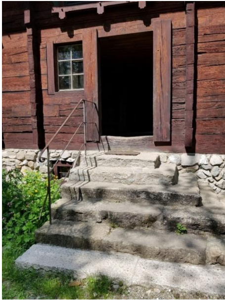
Vordereingang Über 6 Stufen und eine Schwelle zugänglich