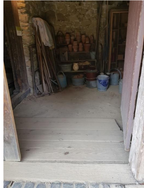
Hölzerne Rampe in den Keller Höhe: 30 cm, Länge: 116 cm