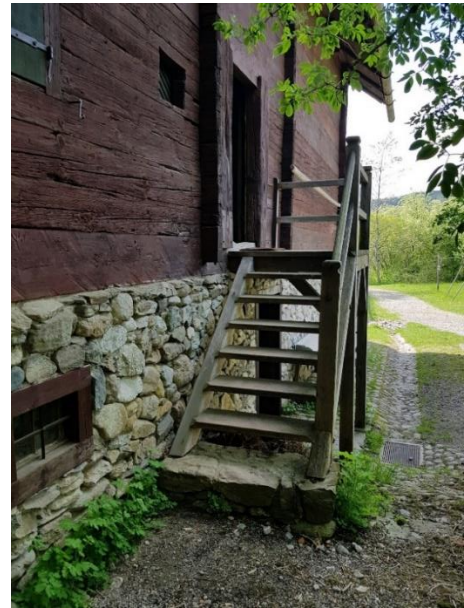
Hintereingang Nur über eine Treppe zugänglich