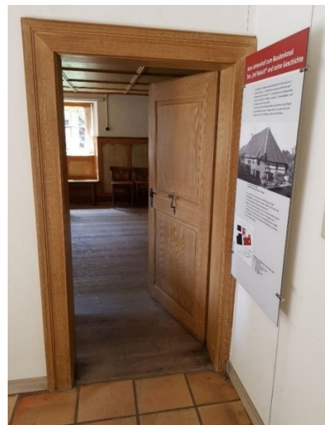
Stube Tür: 84 cm, Schwelle: 1-3 cm, innen 8 cm