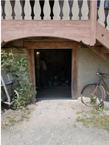
Zugang Keller Tür: 123 cm